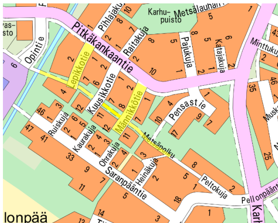
Kuva 1. Suunnittelualue opaskartalla

Männikkötiellä suunnittelualue rajautuu kaavanmukaisten katualuerajojen, sekä etelässä kaavanmukaiseen VL- alueeseen (lähivirkistysalue). Pohjoisessa Pitkäkankaantien nykyisiin jalankulku- ja polkupyörävyöhyihin. Metsäpolku (jalankulku- ja polkupyörävyöhyä) rajautuu Pasko-ojan ja Heinäkujan väliselle VL-alueelle.